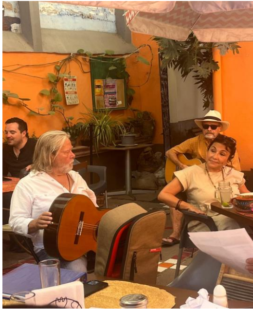
Tocando en café, Sabor Natura en san Miguel de Allende, GTO